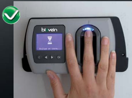
Vue sans casquette View without cover

Correct finger positioning is very important while using the Biovein, as well during enrollment