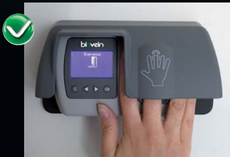
Vue avec casquette View with cover