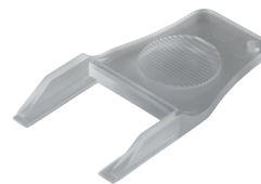
➤ RCP-K Clé de réarmement