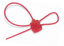
➤ RPS3KG1.2 Lot de 10 pc scellés ("plombs") plastique