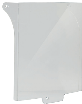
➤ RCP-C Capot de protection double action