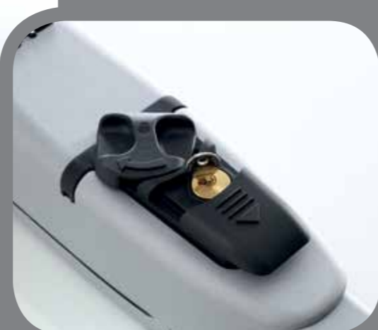
Déverrouillage par clé facile d'utilisation

• Le 413 existe en ensemble complet TRENDY Kit