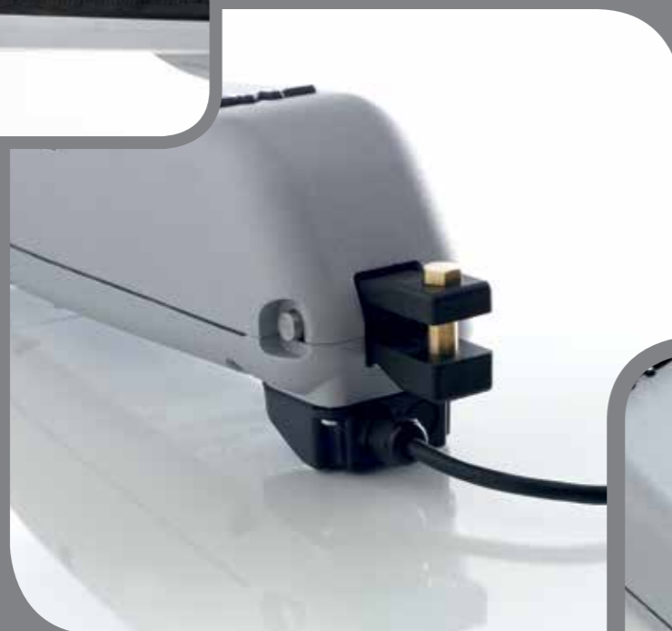
Branchement du câble d'alimentation par boîtier étanche