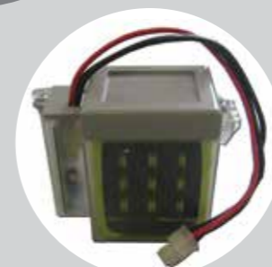
Batterie de secours (pour le 24V)

• Options : système GATECODER de détection d'obstacles et fins de course